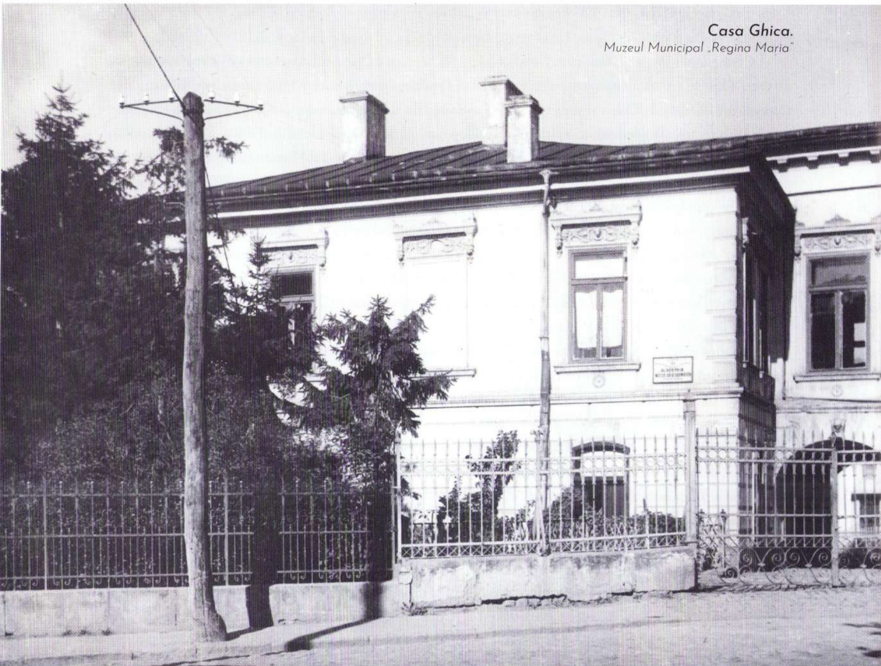
Casa Ghica. Muzeul Municipal „Regina Maria”